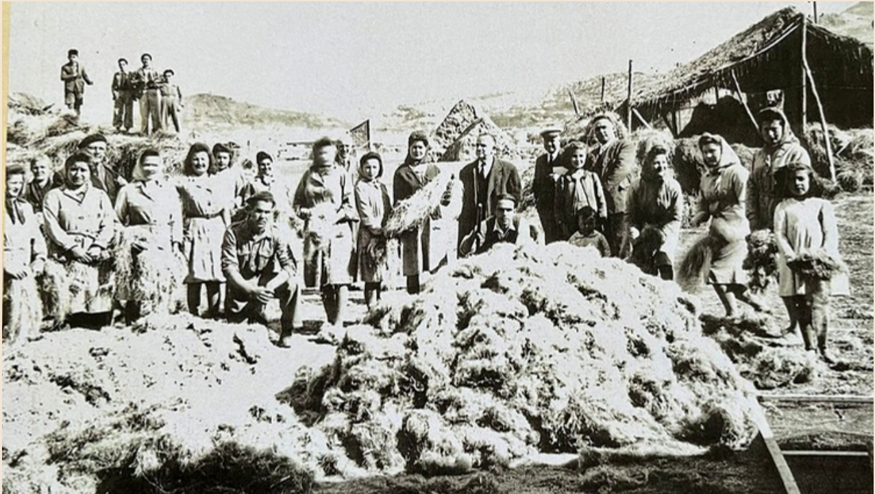
Trabajadores de la Fábrica del lino

El edificio data de principios del siglo XX. Fue construido por la familia Espadafor y, a lo largo de su historia, sirvió como destilería de anís, almazara, planta procesadora de gas y vinagre e, incluso, como almacén de productos agrícolas originarios de la Vega. Fue una de las muchas fábricas que hubo en Pinos Puente, pues fue un municipio con mucha industria, y que dieron trabajo a muchas mujeres. Por ejemplo, trabajaron en las fábricas de tabaco, en la de envasado y en la de lino.