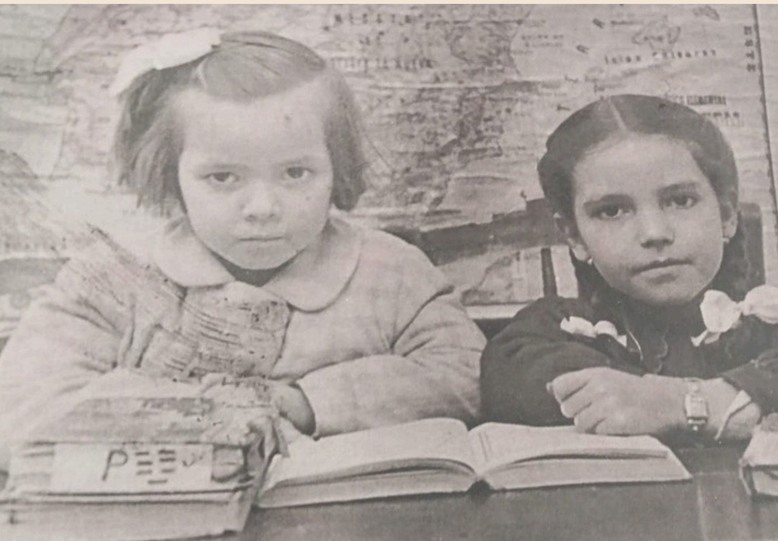
En la Escuela Nacional