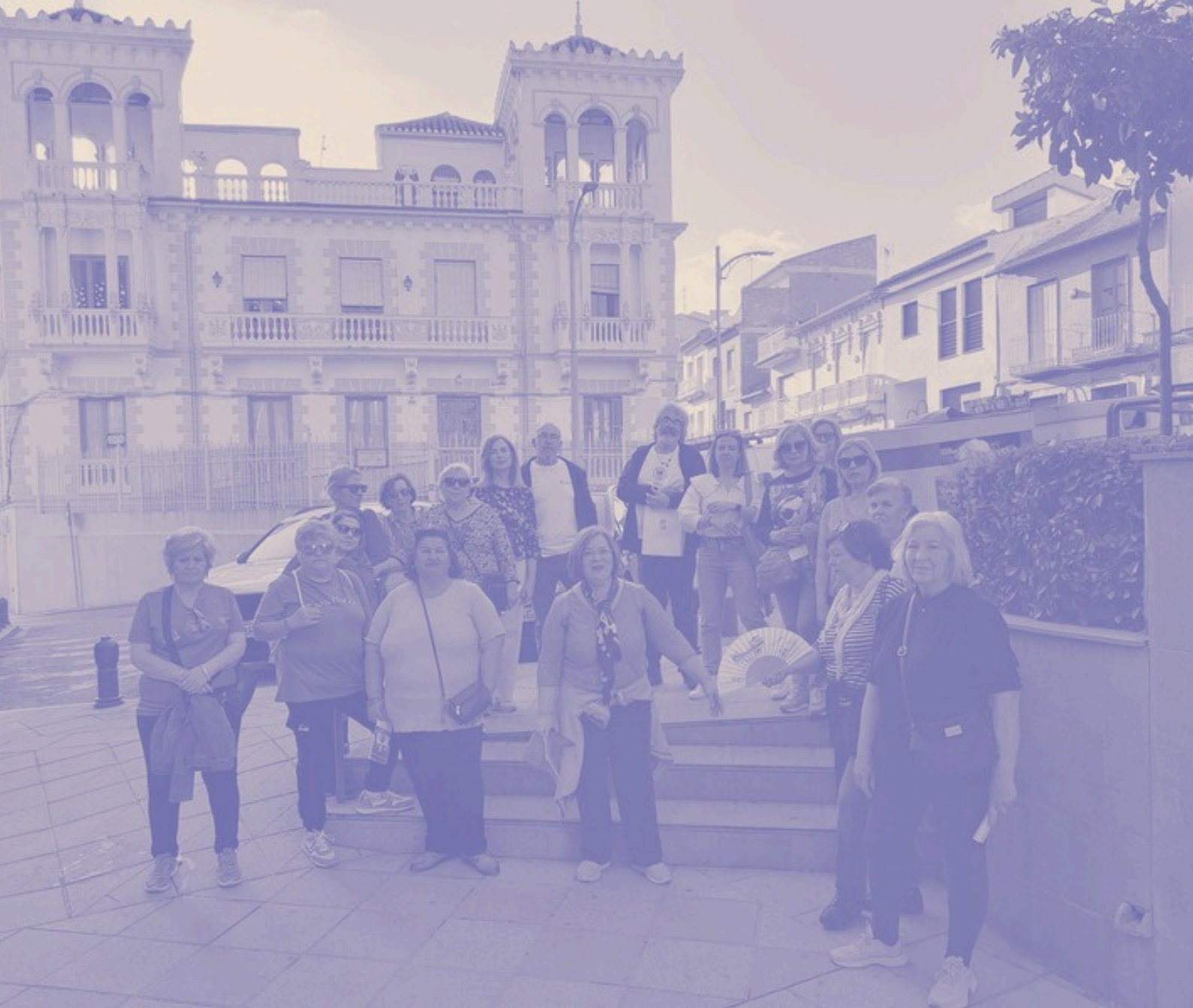
Pinos Puente. Grupo motor