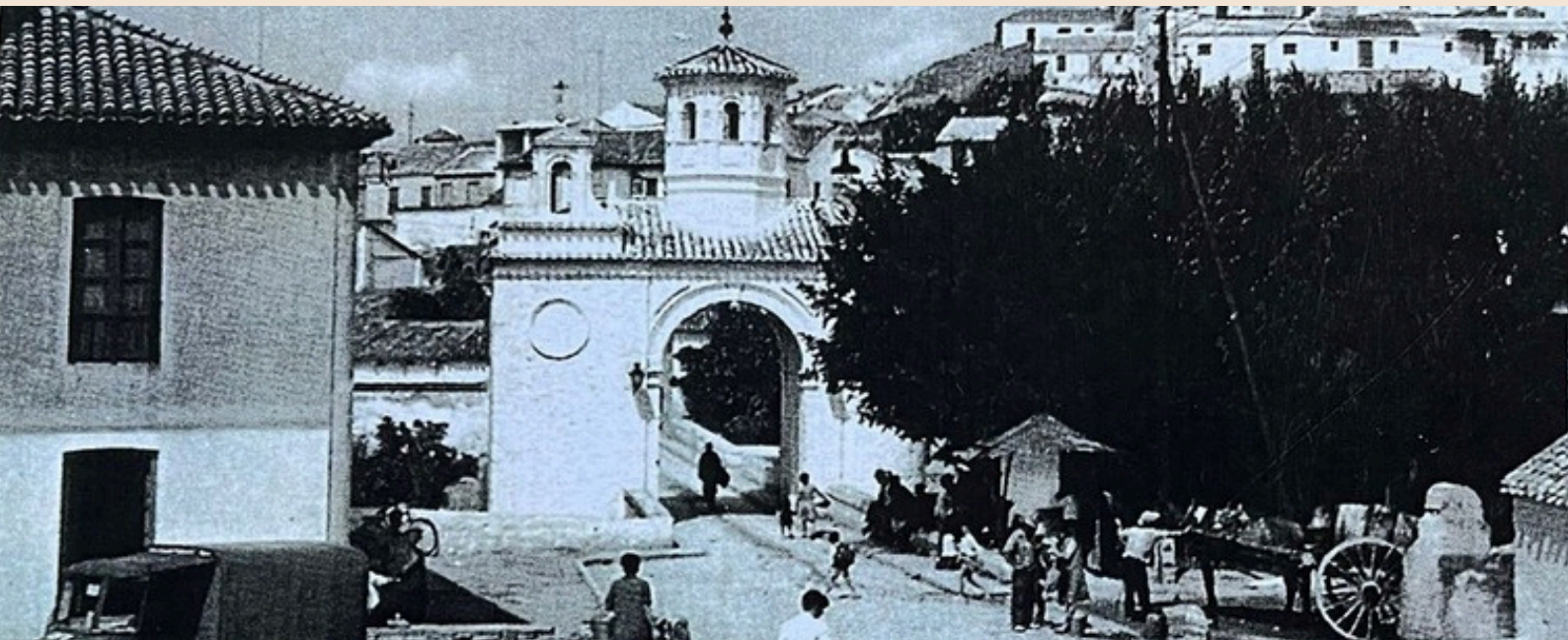
Puente de Pinos. Años 60