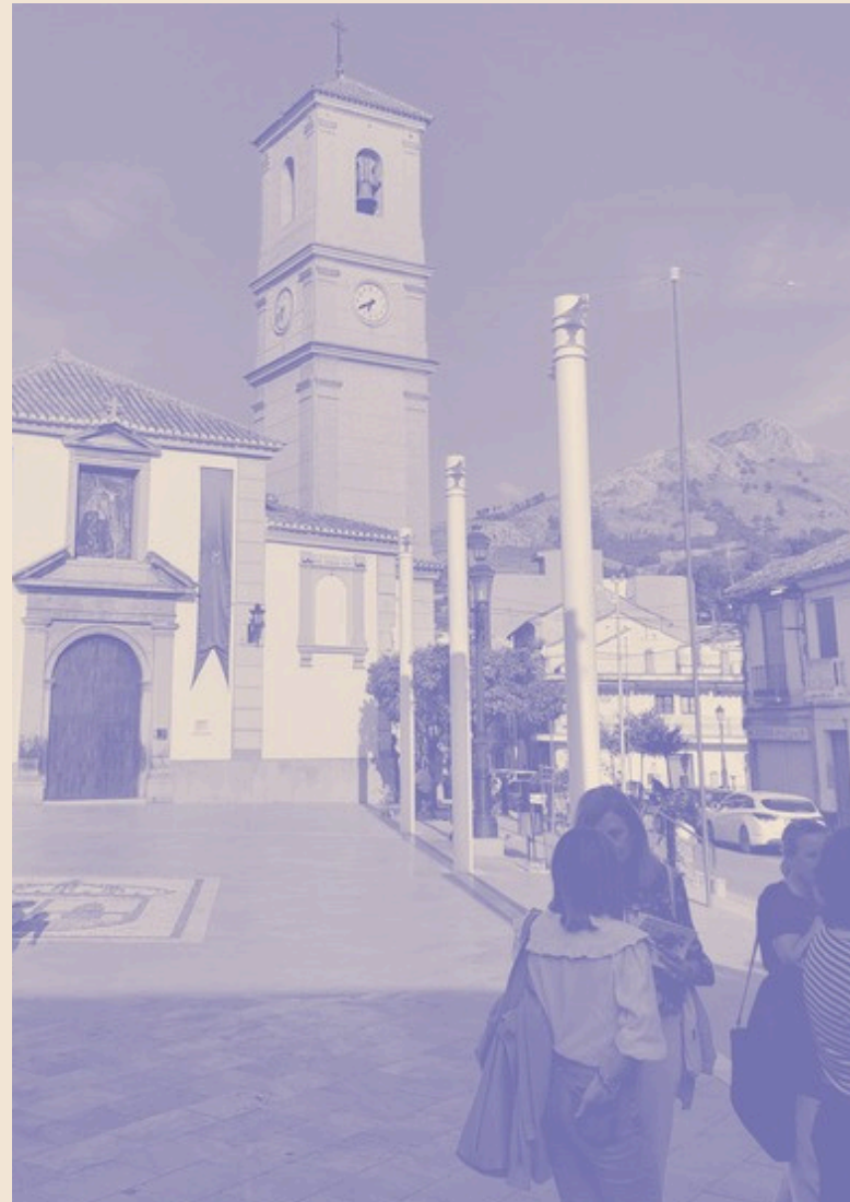
Iglesia de la Consolación