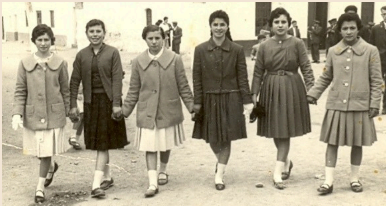
Seis mozuelas en las fiestas de Purchil

Las mujeres lavaban o bien en el río (que aún no estaba encauzado), o en la acequia que pasaba cerca de aquí, pues en Ambroz no había lavaderos construidos.