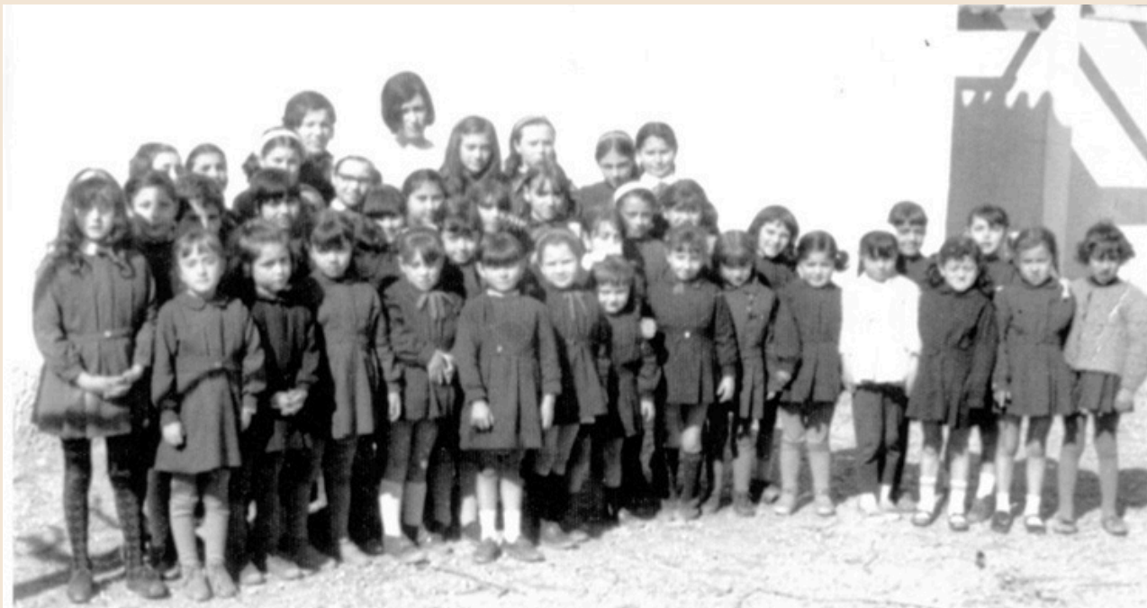
Las alumnas de Purchil