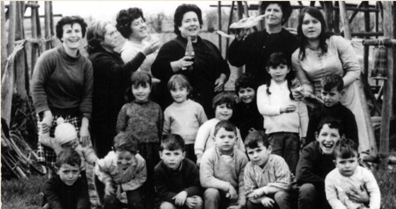
Bebiendo en las merendicas

Este camino conecta con Purchil, donde continúa el itinerario. Paseando tan próximas a la Vega , las mujeres recuerdan cómo con las hojas del maíz se hacían las farfollas con las que rellenaban los colchones.