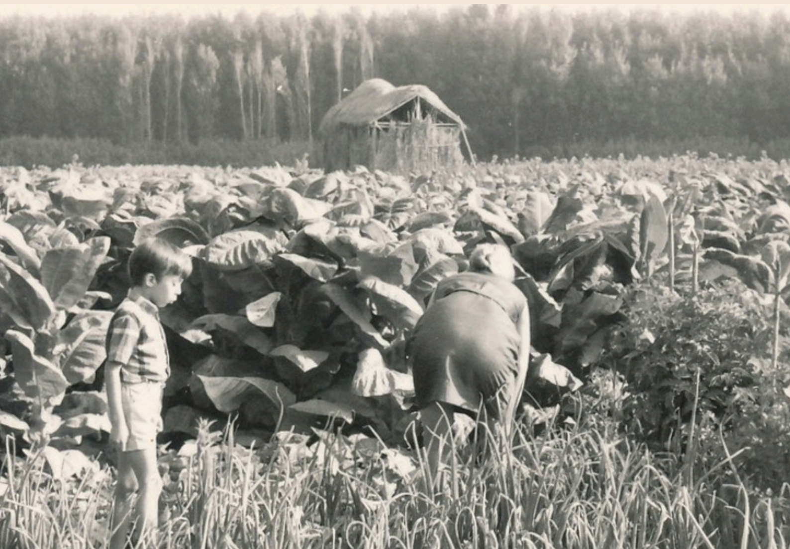
Tareas de tabaco